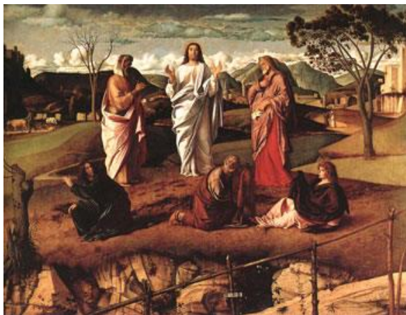
Cuadro 5: Transfiguración de Jesús.

Diácono: hermano mío, ya han pasado nueve (9) años de la luz, que Dios bendiga tus palabras. Hermanos todos, cerremos este hermoso sacramento del Espíritu como nuestro Señor Jesucristo nos reveló. (Se reza el Padre Nuestro). (†).