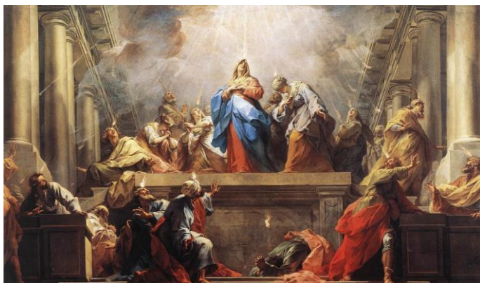
Cuadro 7: Pentecostés.

Ejercicios espirituales: para este sacramento se recomienda que el hermano: evalúe muy bien su ego, así como la renuncia de la individualidad. Para ello, se recomienda la práctica profunda de la meditación y la autoindagación del ser, tener una autoidentificación clara con todos los seres, la vida y el espíritu santo en general, y por lo tanto no debe juzgar. En la meditación ya debe construir el templo de la palabra de Dios o el no-templo, debe promulgar la palabra de Jesucristo mediante la creación de nuevas cruces, se recomienda que reflexione sobre la relación de Dios con todas las cosas, el Hijo, la Virgen María, los Santos Apóstoles y la Iglesia de Dios.