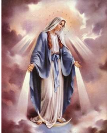
Cuadro 2: Virgen María.

Ejercicios Espirituales: para este sacramento se recomienda que el hermano trabaje el carácter, tanto en las reuniones cristianas como en la familia y en la sociedad. Para ello, se recomienda la práctica de la respiración, compartir ágapes con los demás hermanos, prestar servicios de caridad, participar de acciones sociales demostrando su disciplina y su moral, además de confesarse regularmente y leer la biblia diariamente. En cuanto a la meditación, ya debe poseer cierta rutina y puede llevar un diario cristiano, se recomienda que reflexione sobre las causas y los efectos.