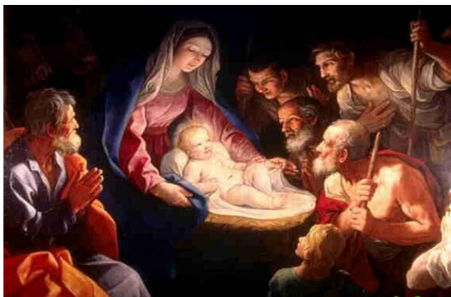
Cuadro 1: Navidad de Jesús.

Diácono: hermano mío, ya ha pasado un (1) año de la luz, que Dios bendiga tus pasos de ahora en adelante. Hermanos todos, cerremos este hermoso sacramento del Padre como nuestro Señor Jesucristo nos reveló. (Se reza el Padre Nuestro). (†).