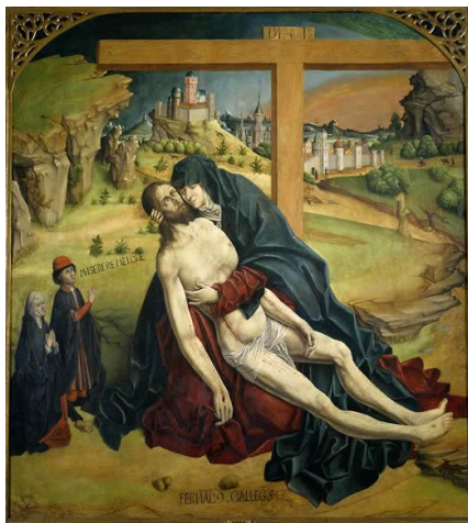
Cuadro 6: La Piedad.

Diácono: Hermano mío, ya han pasado treinta ( 30 ) años de la luz, que Dios bendiga tus sentimientos. Hermanos todos, cerremos este hermoso sacramento del Espíritu como nuestro Señor Jesucristo nos ha revelado. (Se reza el Padre Nuestro). (†).