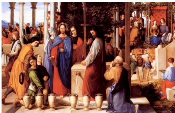
Cuadro 4: Bodas de Cana.

Ejercicios Espirituales: para este sacramento se recomienda que el hermano evalúe muy bien sus pensamientos, así como el dominio de la mente. Para ello, se recomienda la práctica del silencio, la relajación, la reflexión, la concentración y la contemplación, la lectura bíblica en grupo, la caridad y la confesión, además de no codiciar. En la meditación ya debe trascender la ilusión (o espejo) de la mente, debe dominar su cuerpo, se recomienda que reflexione sobre la creación, el Espíritu Santo y la polaridad.